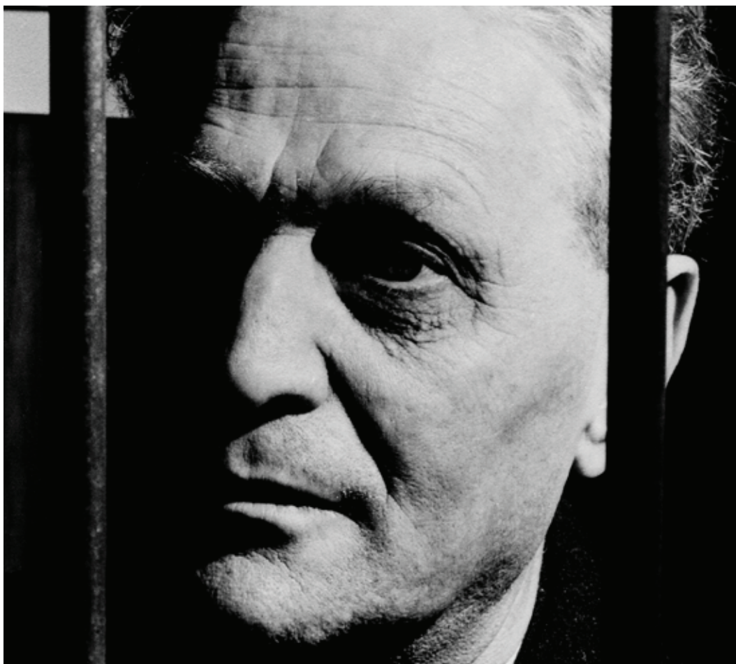
Фото: Пастор Ричард Вурмбранд

Пастор Вурмбранд знал, что христианские семьи по всему миру готовы помогать и молиться за семьи, которые страдают за свою веру, и считают это служение благословением. Поэтому после освобождения из тюрьмы пастор основал организацию «Голос мучеников» для оказания помощи преследуемым христианам и членам их семей, которая до сих пор служит семьям преследуемых пасторов и других христиан, помогая обеспечивать ежедневные нужды их семей.