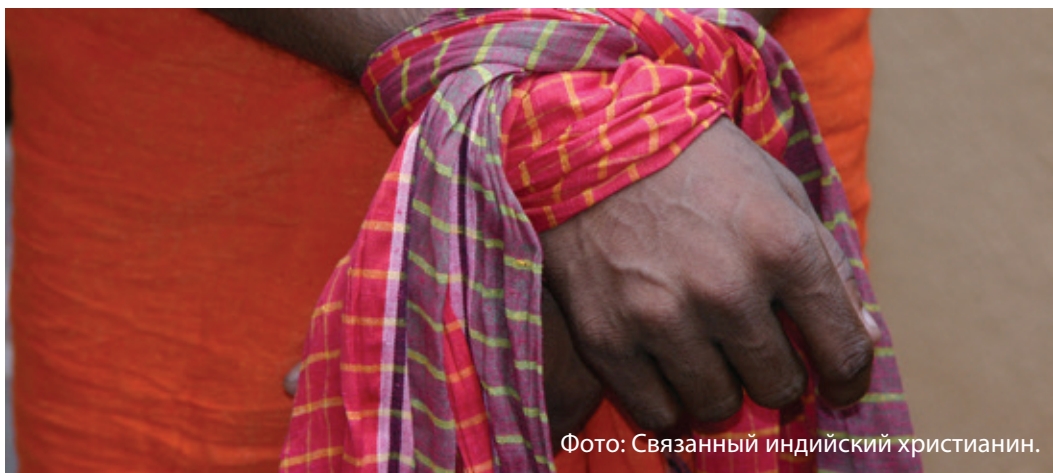
Фото: Связанный индийский христианин.

Призовите детей помнить о преследуемых христианах, к которым они могут быть «привязаны» молитвой так же, как «заключённые» в вашей группе «привязаны» друг к другу верёвками.