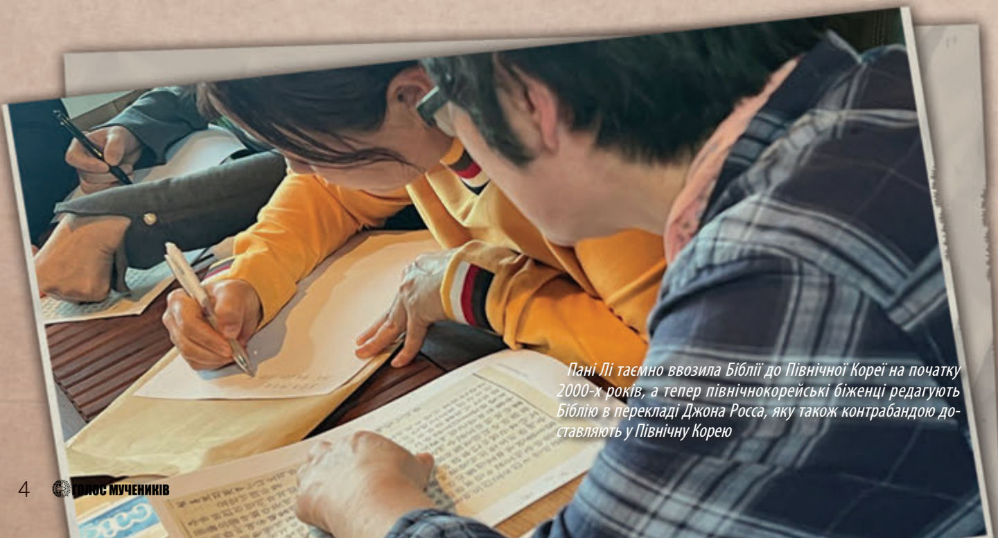
Пані Лі таємно ввозила Біблії до Північної Кореї на початку 2000-х років, а тепер північнокорейські біженці редагують Біблію в перекладі Джона Росса, яку також контрабандою доставляють у Північну Корею

Під час розслідування північнокорейською владою діяльності затриманої раніше контрабандистки підслідна намагалася відвернути увагу від себе, даючи свідчення проти інших. У результаті пані Лі заарештували й почали допитувати.