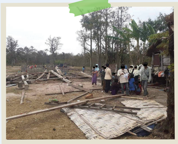
Лаоські християни стоять серед руйн своїх будинків та будівлі церкви, які минулого року зруйнували їхні односельці

Представники більшості племен, що мешкають у віддалених лаоських селах є анімістами й поклоняються духам предків. Вони часто приписують проблеми свого села (наприклад, хвороби) присутності християн. Дітей Божих змушують відмовитися від віри в Христа або залишити село, а якщо вони не підкоряються, їхні будинки, церкви та Біблії знищують.