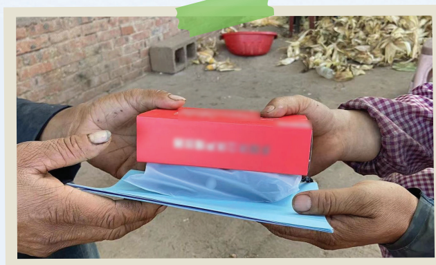
Аудіо-Біблія, що розповсюджується в сільських районах Китаю

«Я дякую Богу за те, що Він дозволив мені побачити аудіо-Біблію, я також дякую за це вам. Економіка Китаю перебуває в кризі, й умови життя людей нині найгірші за останні роки. У такі надзви-