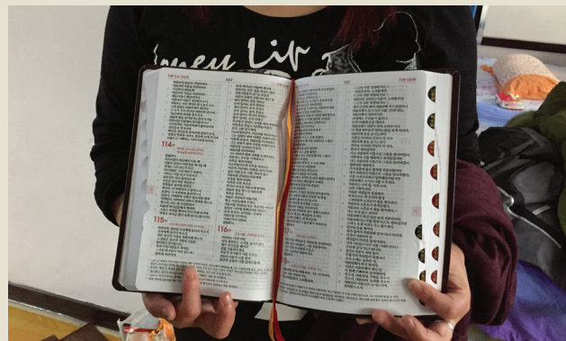
Північнокорейська біженка тримає в руках північнокорейську навчальну Біблію

«Щодо нас, то, провадячи життя віри, ми дуже часто потрапляємо в пастку власної жадібності. Але Бог прощає наші помилки й піднімає нас, щоб ми могли продовжувати йти правильним шляхом».