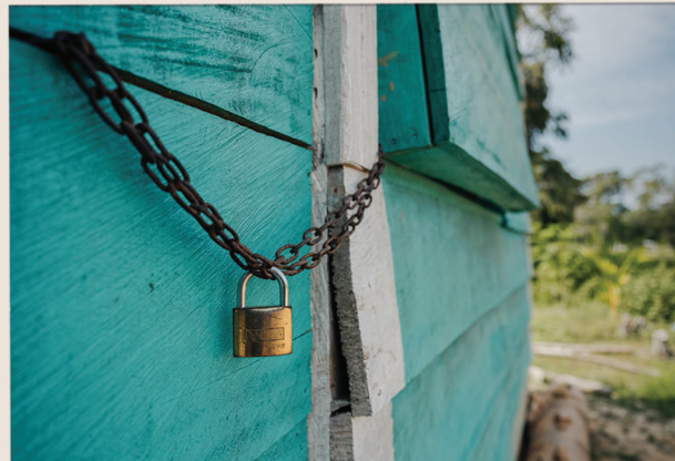
Марксистские группировки запрещают богослужения и запирают церковные здания в «красных зонах».