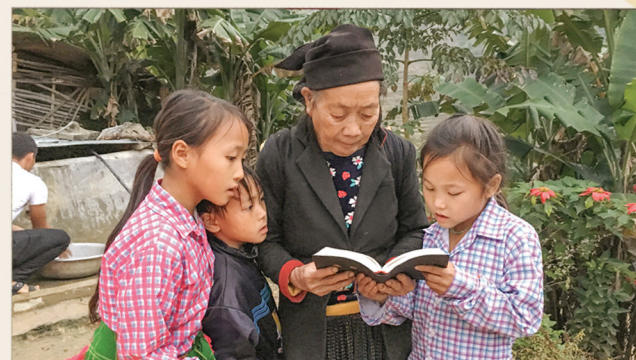
Дитяче служіння було основним напрямком церковного зростання з часів війни у В'єтнамі