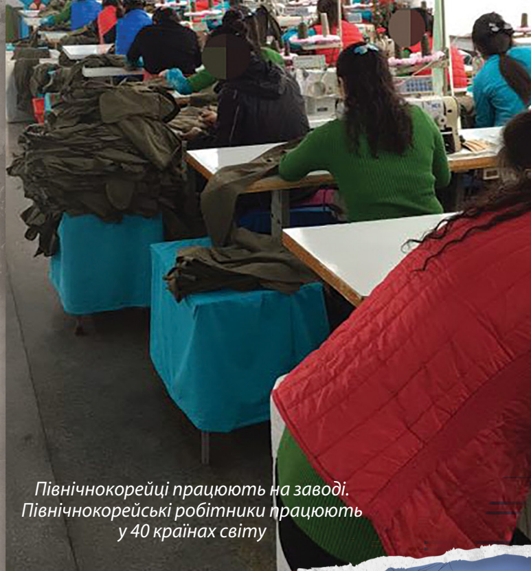
Північнокорейці працюють на заводі. Північнокорейські робітники працюють у 40 країнах світу

Християни в Південній Кореї та в усьому світі іноді помилково вважають, що єдиними способами місіонерської діяльності, можливими щодо північнокорейців, є викладання в північнокорейських університетах, надсилання грошей на гуманітарну допомогу через проекти, схвалені північнокорейським урядом, або проведення навчальних програм для планування місій у майбутньому, коли Північна Корея може «відкритися» для Євангелія. Але, як написав апостол Павло в 2 Тимофія 2:9: «...Слова Божого не ув'язнити!» Біблія і нині продовжує потрапляти до Північної Кореї та досягати північнокорейських громадян, які працюють за кордоном. Сьогодні північнокорейці читають Писання і змінюються під його впливом більше, ніж будь-коли в історії.