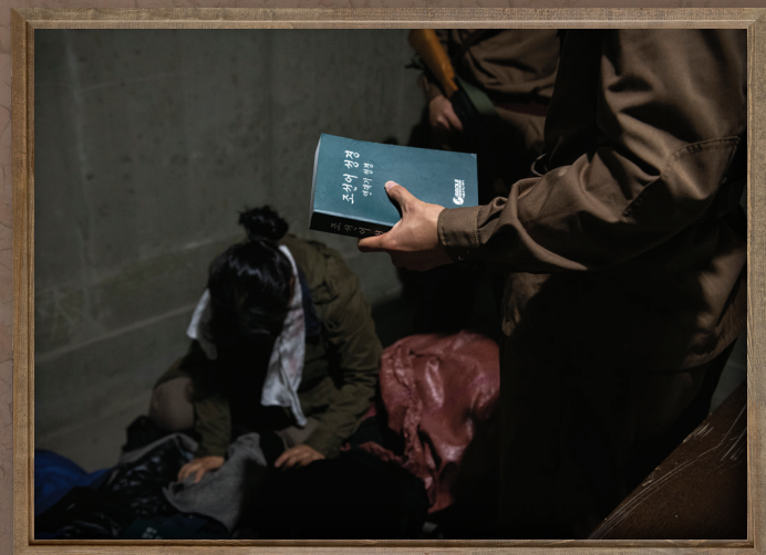
Реконструкція реальної історії допиту північнокорейської жінки, яку затримали з Біблією