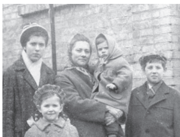
Перед поездкой к папе в лагерь на Северный Урал, 1968 г.