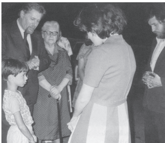
Папа совершает молитву в первые минуты встречи с семьей