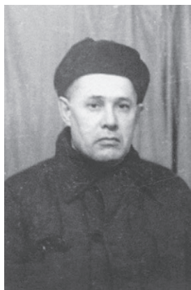
Папа в лагере в тю- ремной форме