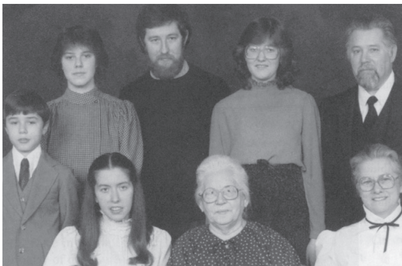
Семья Винс в Элкарте, США, 1981 г.