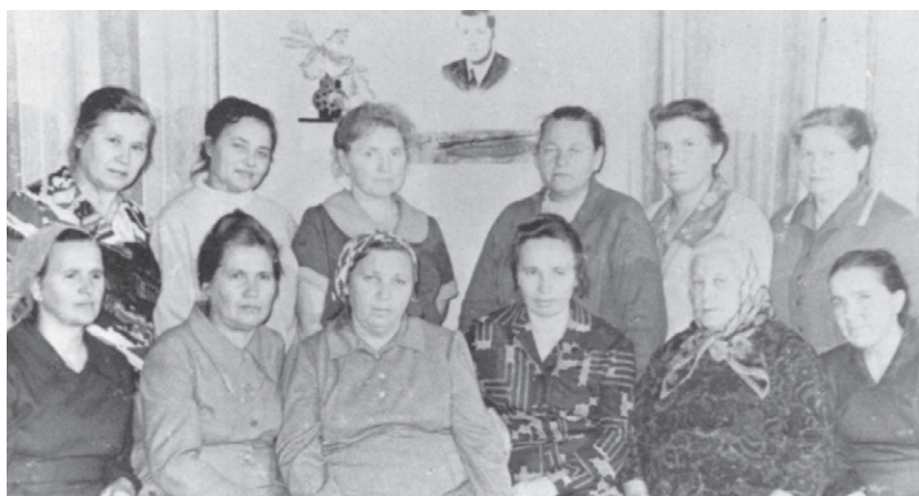
Совещание Совета родственников узников, проходившее в нашем доме, 1979 г.