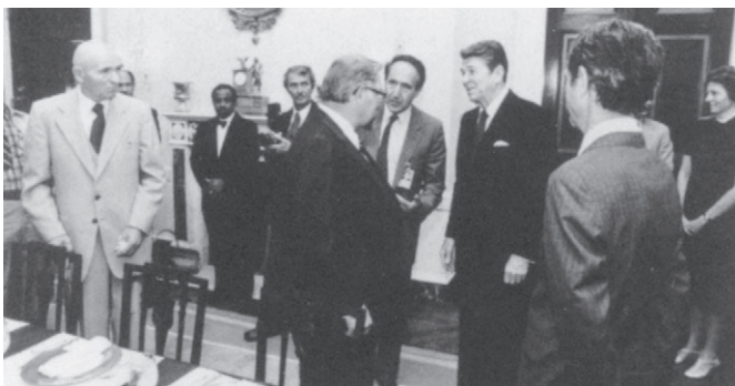
Г.П.Винс в Белом Доме во время встречи с президентом Р.Рейганом, 1982 г.