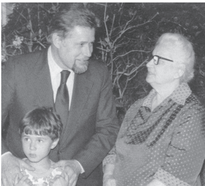
Долгожданная встреча: папа с бабушкой и Шурой. Вермонт, США, 14 июня 1979 г.