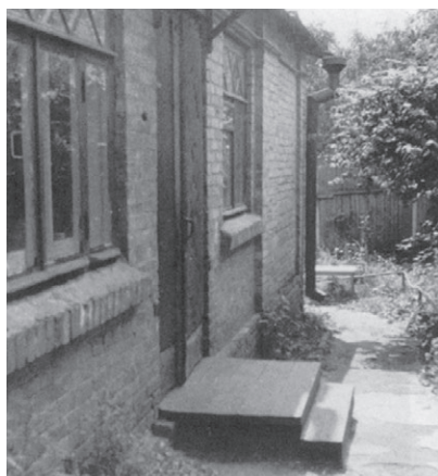
Наш дом на Сошенко