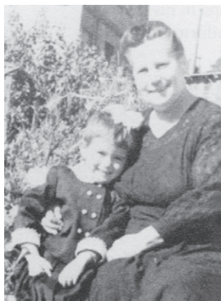
Бабушка с «дочкой-внучкой»