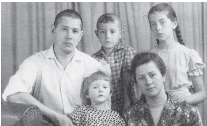
Наша семья в 1963 году, после того, как папа отсидел 15 суток.