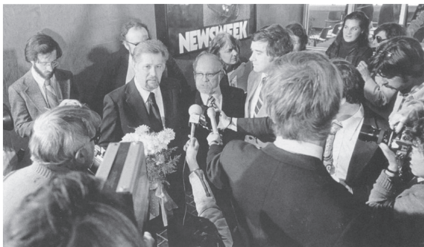
Пресс-конференция в Нью-Йорке, 28 апреля 1979 г, на следующий день после освобождения