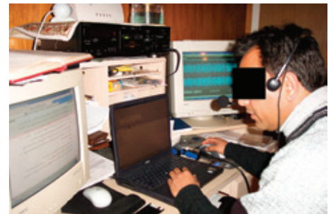
Наши партнёры получают сотни звонков от афганцев, которые хотят больше узнать о христианстве.

Опытные руководители церкви встречаются с новообращённым верующим в течение нескольких месяцев, прежде чем представлять его или её другим верующим. Новообращённым часто приходится проехать много часов в автобусе, чтобы иметь возможность помолиться и поклониться Богу с другими христианами. Или же долго ездить в своём автомобиле, чтобы беспрепятственно молиться и петь Богу.