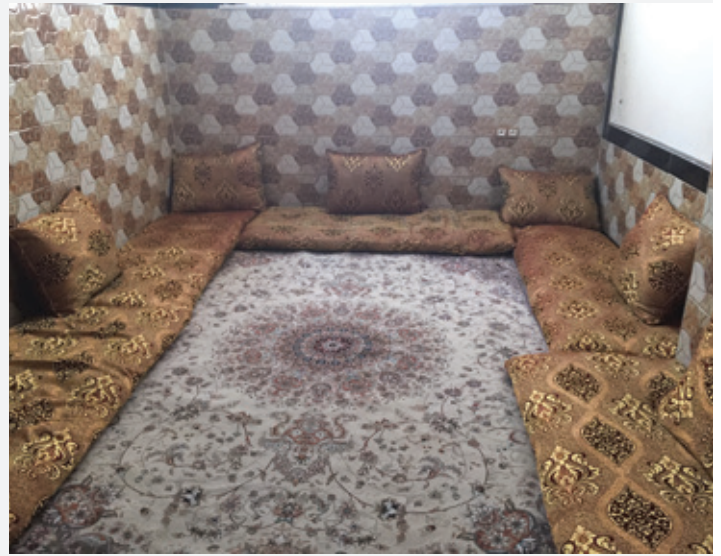
Каждую неделю домашняя церковь тайно собирается для поклонения в этой комнате. Верующие попросили нашего сотрудника не снимать их по соображениям безопасности.