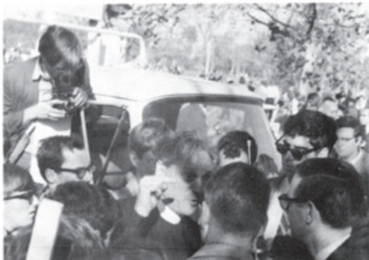
Rev. Richard Wurmbrand (above) at Pentagon being interviewed. (Below), he speaks to crowd and shows scars inflicted by Reds with knives and flame.