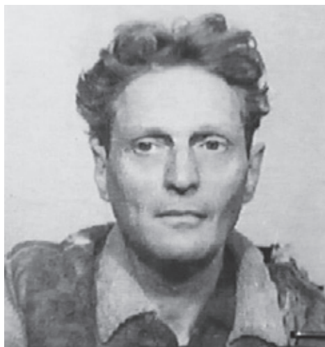
Снимок Ричарда Вурмбранда, сделанный в 1951 году в тюрьме «Тыргу-Окна».