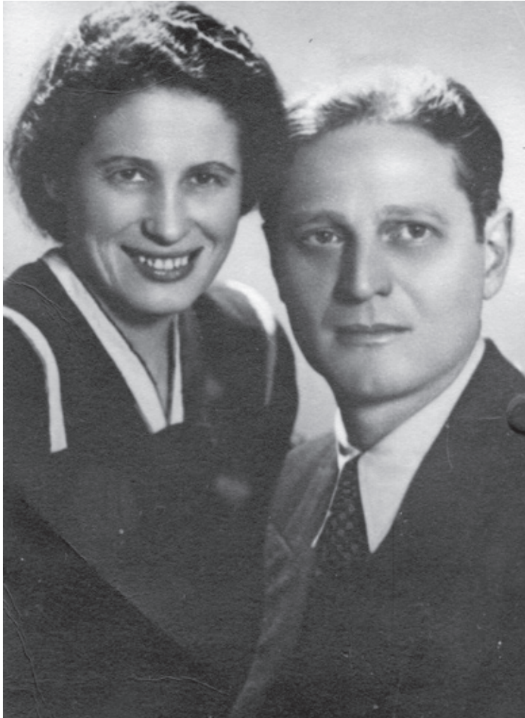
Ричард и Сабина Вурмбранд