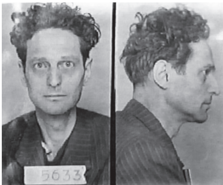
Снимок Ричарда Вурмбранда из архивов тюрьмы, сделанный после того, как 29 февраля 1948 года он был похищен с улицы Бухареста и заключён коммунистами под чужим именем.