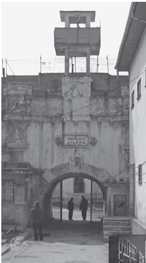
На фото сверху тюрьма «Джи-лава», одно из мест заключения Ричарда Вурмбранда.