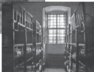
На фото внизу — другое место заключения Ричарда Вурмбранда — тюрьма «Герла», в которой он содержался с 1960 по 1964 год.