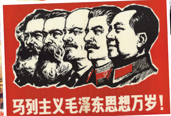
Вверху: Детей, как этих пионеров, пропитывают коммунистической идеологией Внизу слева: В 1966 году Ричард Вурмбранд продемонстрировал Комитету по вопросам безопасности Сената США шрамы, оставшиеся в результате пыток в румынской коммунистической тюрьме Внизу по центру: Коммунистическая пропаганда времён Советского Союза Внизу справа: Пропаганда КНР. Маркс, Энгельс, Ленин, Сталин и Мао. Надпись: «Да здравствует марксизм и мысли Мао Цзэдуна!»