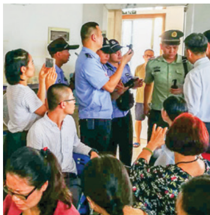
Налёт китайской полиции на домашнюю церковь в Гуанчжоу в августе 2018 года

Некоторые западные политики полагали, что международные деловые отношения Китая заставят его правительство ослабить ограничения прав человека, в том числе и преследования христиан. Однако даже деловые отношения с миром не помешали коммунистическому правительству осуществлять полный контроль над гражданами страны. По мере роста благосостояния Китая растёт и способность правительства отслеживать, контролировать и держать китайский народ «в железном кулаке». Постоянно усиливающиеся репрессии, на-