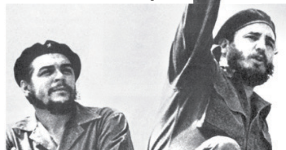
Эрнесто Че Гевара с Фиделем Кастро, который свергнул Фульхенсио Батисту и установил на Кубе коммунистическую диктатуру. От студентов требуют поклонения статуе Че Гевары

во время церковных богослужений и в ежедневной жизни с целью сбора компромата. Один из пасторов рассказал сотруднику «Голоса мучеников» о том, как покающийся шпион признался, что посещал церковь с намерением собрать улики против пастора, однако Бог не позволил ему довести дело до конца. Обычными являются задержания