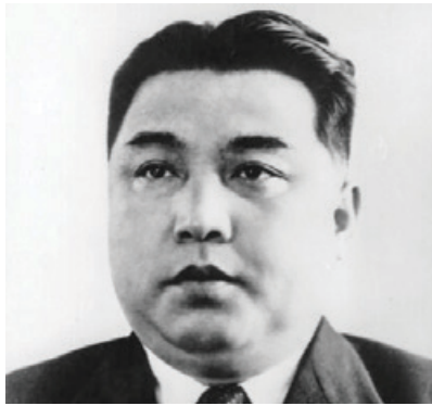
Северокорейский диктатор Ким Ир Сен прошёл обучение в Советском Союзе

После того, как Ким Ир Сен поступил в комсомол, в 1930-х годах