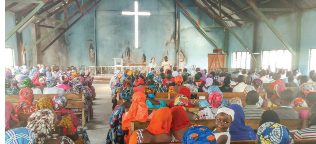
Преданные Богу христиане в Нигерии продолжают проводить богослужения в своих общинах, зная, что их церкви в любое время может подвергнуться нападению со стороны исламских экстремистов