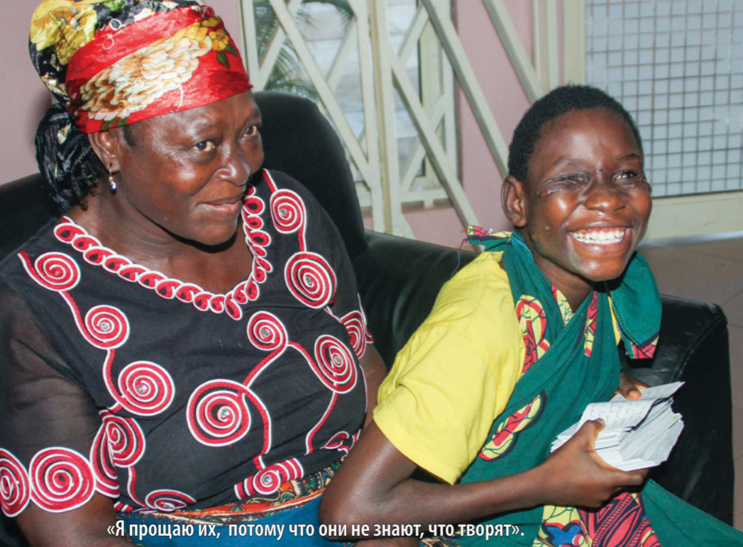
«Я прощаю их, потому что они не знают, что творят».