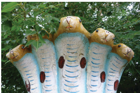
Среди множества лжебогов в сезон дождей индусы особенно почитают змеиных божеств