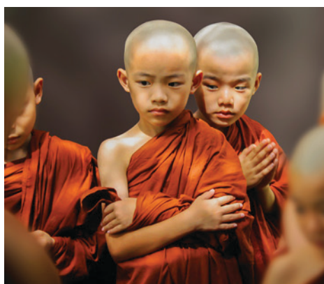
Непальские родители отдают своих детей с раннего возраста в монастыри для обучения буддизму