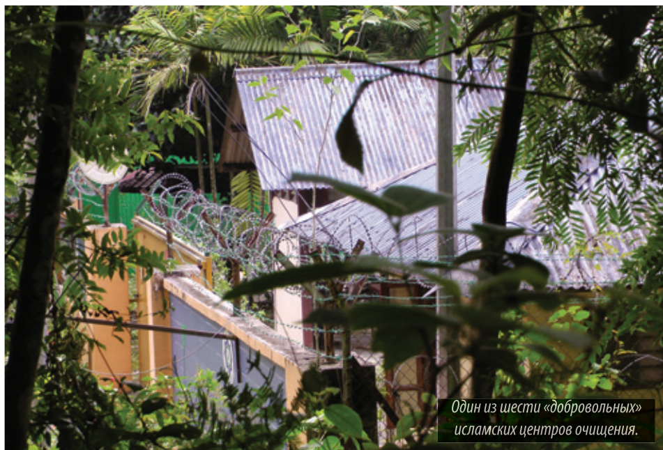
Один из шести «добровольных» исламских центров очищения.

Христиане утверждают, что возле наиболее крупных городов Малайзии существует, по крайней мере, шесть таких центров и множество более мелких, разбросанных по всей сельской местности. Вэб-сайт «Центра очищения «Аквиды»», расположенного неподалеку от города Селангор, утверждает, что его целью является «обеспечение консульта-