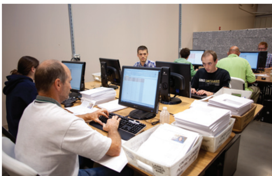
Добровольцы и сотрудники «Голоса мучеников» провели много часов, распечатывая и сортируя ходатайства перед их доставкой в посольство Пакистана.

к петиции на www.CallForMercy.com . Пожалуйста, сообщите об этой возможности своим друзьям и знакомым и призовите их также присоединиться к этой важной кампании.