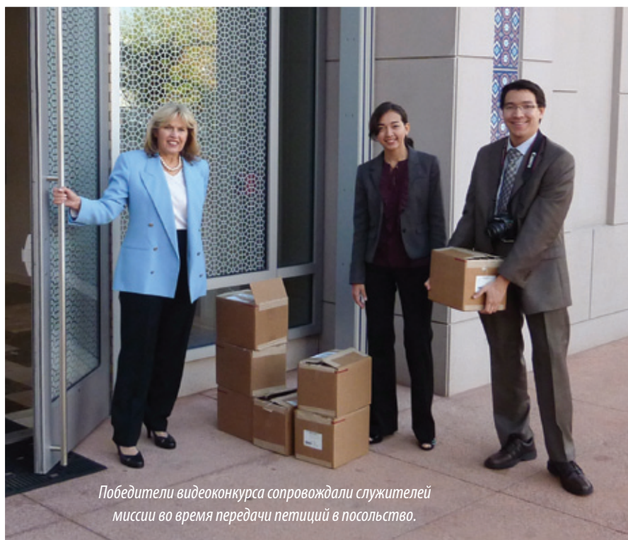
Победители видеоконкурса сопровождали служителей миссии во время передачи петиций в посольство.

Команда «Голоса мучеников» отправилась в Вашингтон, округ Колумбия, США, чтобы передать первую партию «Петиции о пощаде» посольству Пакистана. Члены команды были встречены с вежливостью и вниманием пакистанскими сотрудниками посольства, принявшими более 400 тыс. подписей, в том числе и 150 тыс. подписей христиан Пакистана.