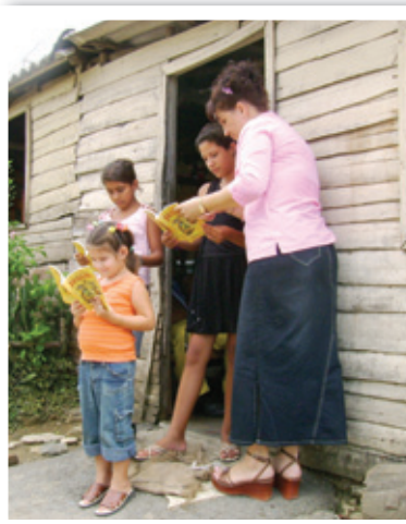
Член домашней церкви на Кубе ходит от двери к двери в сельской местности и делится Евангелием.

Со времён коммунистического переворота 1956 года на Кубе не было построено ни одной новой церкви, а существующие церкви были закрыты или перемещены. В течение многих лет руководство церкви