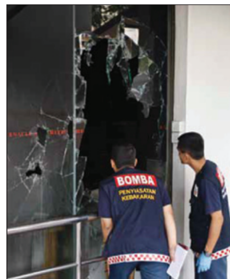
Эта церковь в городе Куала-Лумпур была взорвана в январе 2010 года вследствие споров относительно того, какое слово христиане могут использовать для обозначения понятия «Бог» в Библии.