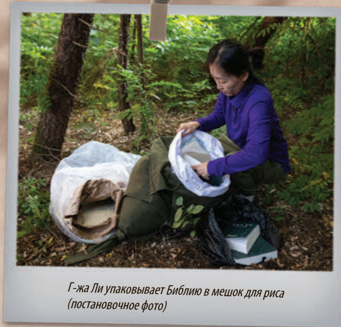
Г-жа Ли упаковывает Библию в мешок для риса (постановочное фото)

внимание от себя, давая показания против других. В результате г-жу Ли арестовали и стали допрашивать.