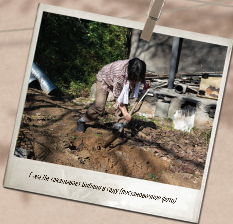
Г-жа Ли закапывает Библию в саду (постановочное фото)